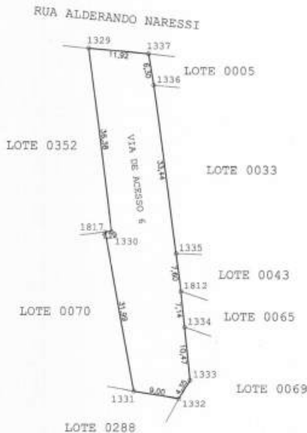
TABELA DE ALINHAMENTOS